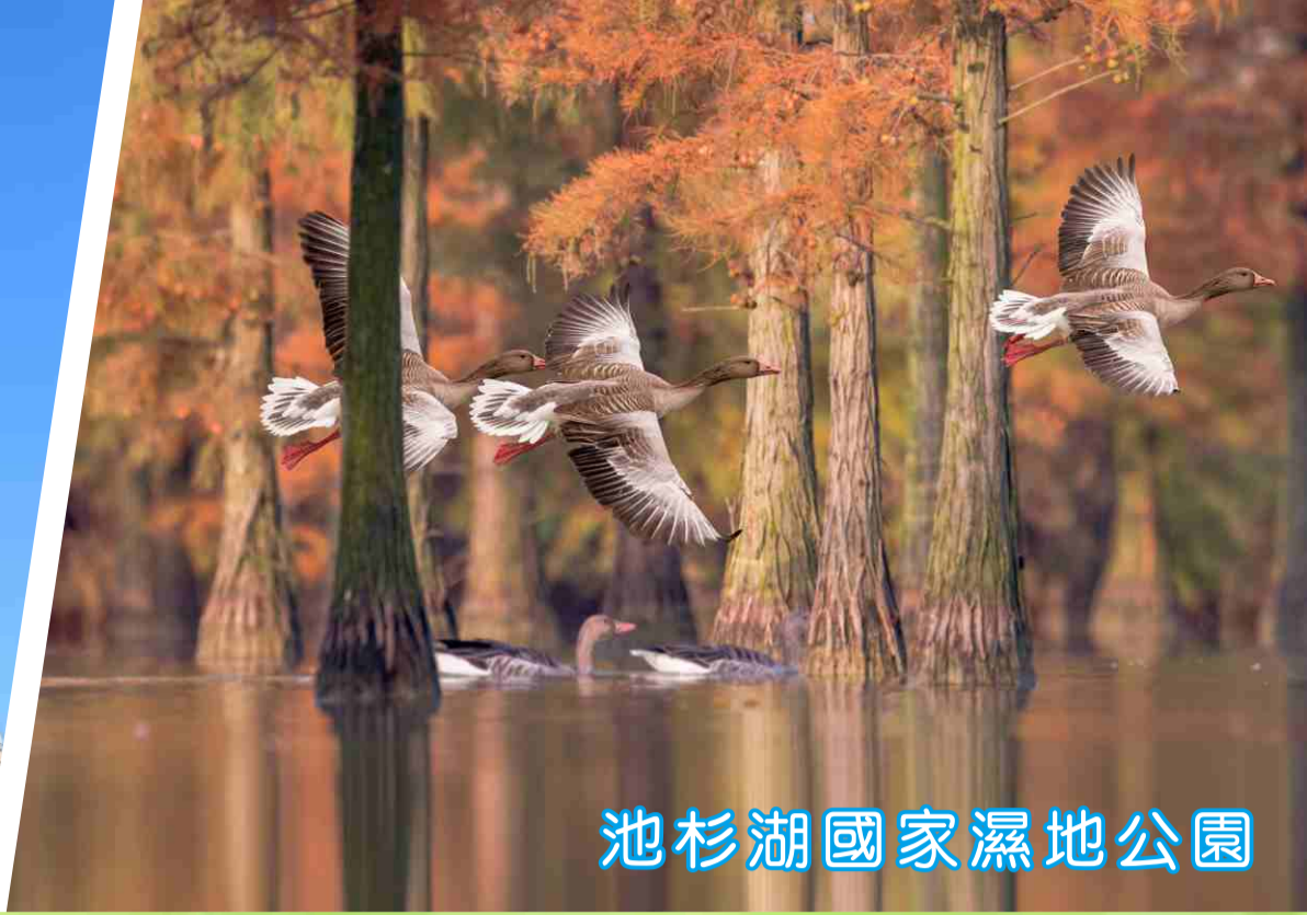
池杉湖國家濕地公園